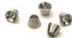
Vordere Ferrulen, Edelstahl, 5180-4108