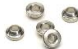
Hintere Ferrulen, 1/16", 5180-4114