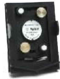
Durchflusszelle für G1321A Fluoreszenzdetektor, G1321-60005