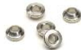
Hintere Ferrulen, 1/16", 5180-4114